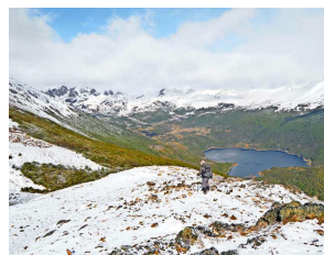
Dientes de Navarino.