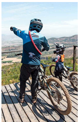
Está en Boco, cerca de Quillota.