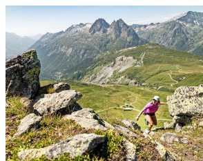
En el PTL de los Alpes.