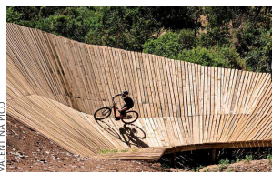
Las rutas fueron diseñadas por arquitectos. Abrió sus puertas hace un mes.